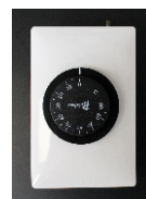
3. Termostato análogo